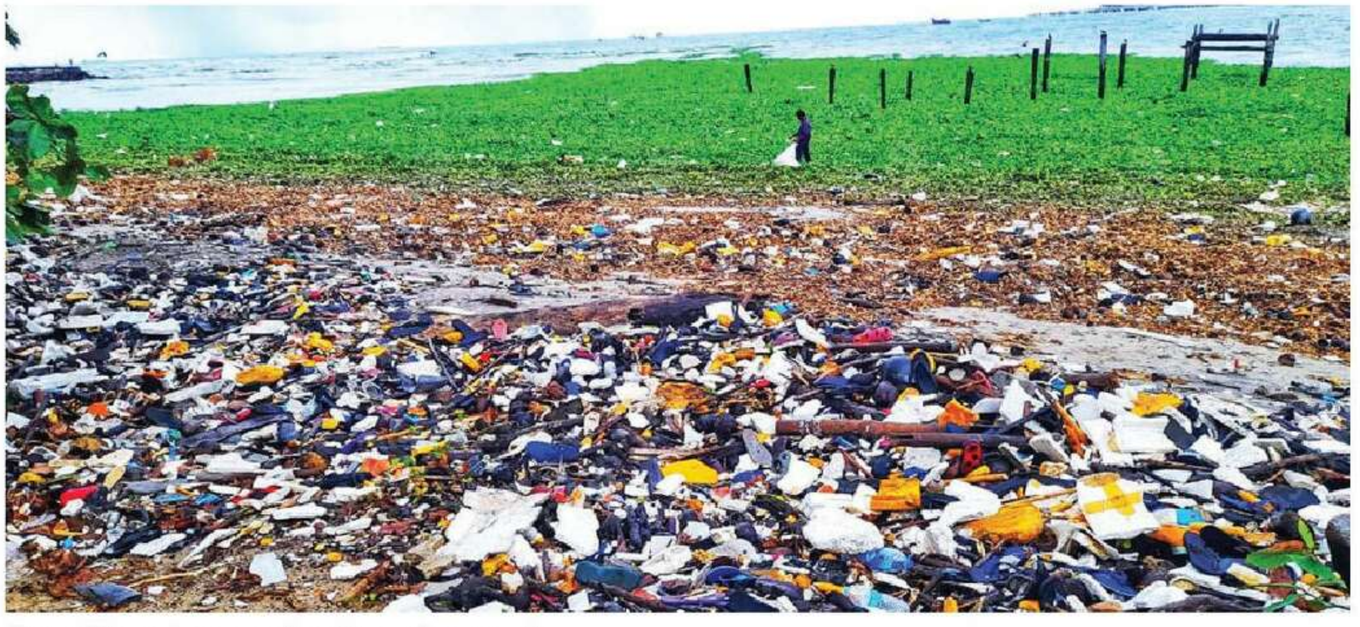
ഫോർട്ട്കൊച്ചി കടപ്പുറത്ത് മാലിന്യ നിറഞ്ഞപ്പോൾ

ഫോർട്ട്കൊച്ചി കടപ്പുറം ശുചീകരണത്തിന് സവിധാനം വരുന്നു. പ്ലാൻ അറ്റ് എർത്ത് എന്ന സന്നദ്ധ സംഘടനയുടെ സഹകരണത്തോടെ പദ്ധതി നടപ്പാക്കാനാണ് തീരുമാനം. കൊച്ചിൻ ഹെറിറ്റേജ് സോൺ കൺസർവേഷൻ സൊസൈറ്റിയും, ഡി.ടി.പി.സി.യും ഇതിന് നേതൃത്വം നൽകും.