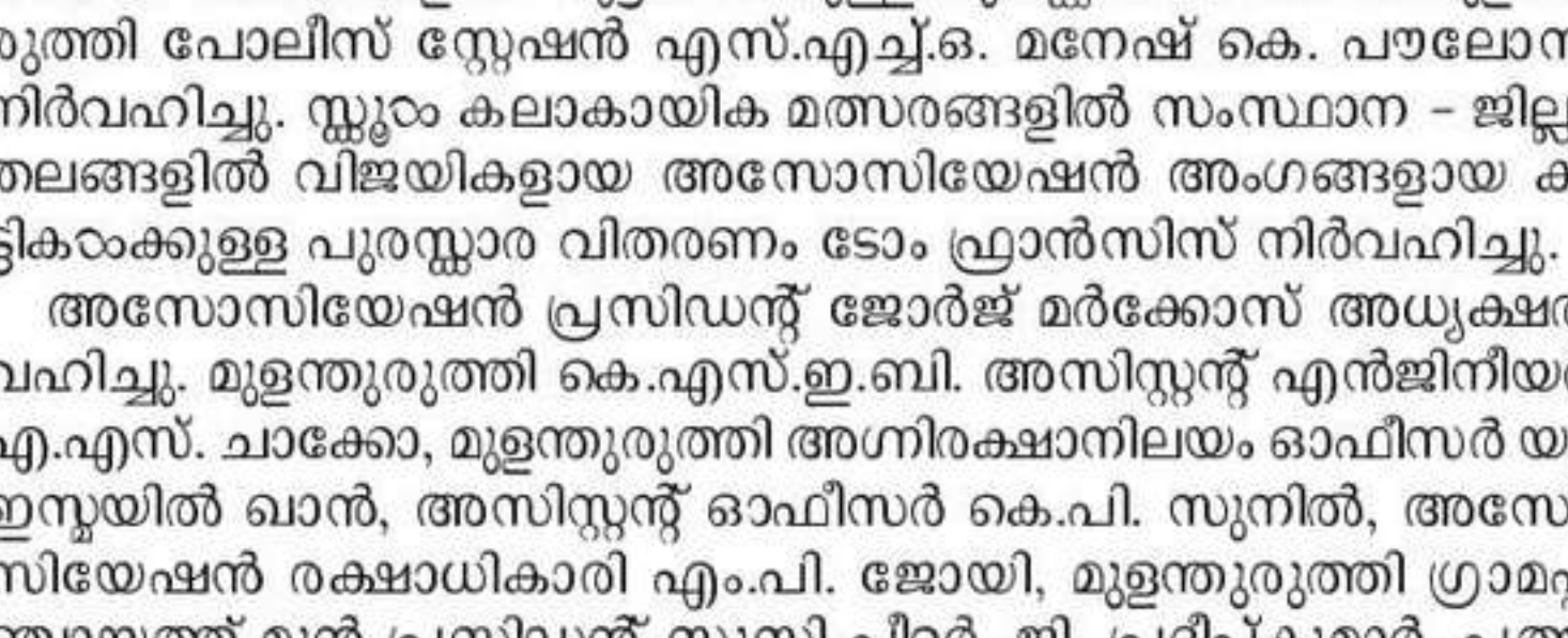
പുഷ്പിളി റെസിഡൻസ് അസോസിയേഷൻ കുടുംബസംഗമം

പുഷ്പിളി റെസിഡൻസ് അസോസിയേഷൻ കുടുംബസംഗമം. പുഷ്പിളി റെസിഡൻസ് അസോസിയേഷൻ കുടുംബസംഗമം.