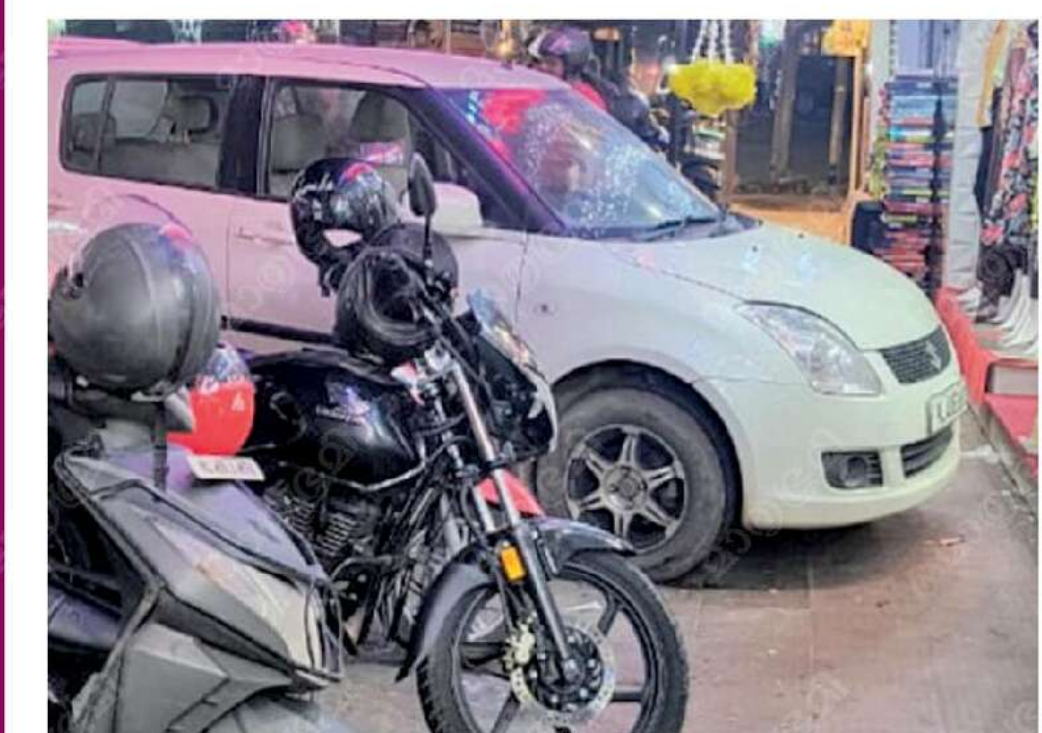
തൃപ്പൂണിത്തുറ സ്റ്റാമ്പു-കിഴക്കേക്കോട്ട് റോഡിൽ നടപ്പാതയിൽ വഹനങ്ങൾ കയറ്റി ഇട്ടിരിക്കുന്നു

തൃപ്പൂണിത്തുറ നഗരത്തിൽ നടപ്പാതകളിൽ വാഹന പാർക്കിങ് മൂലം കാൽനട യാത്രക്കാർക്ക് ദുരിതം. സ്റ്റാമ്പു-കിഴക്കേക്കോട്ട് റോഡ്, മുനിസിപ്പൽ ബസ് സ്റ്റാൻഡ് റോഡ്, ലായം റോഡ്, സന്യുത കോളേജ് റോഡ്, വടക്കേക്കോട്ട് എസ്.എൻ. ജെ.ജെ. റോഡ് എന്നിവിടങ്ങളിലൊക്കെ നടപ്പാതകളിൽ അനധികൃത വാഹന പാർക്കിങ് കാണാം. കാര്യം ഇരുപതുവാഹനങ്ങളും നടപ്പാതകളിൽ കയറ്റി ഇടുന്നുണ്ട്. ആളുകൾക്ക് നടപ്പാത നിർമ്മിച്ചിട്ടുണ്ടെങ്കിലും അതിന്റെ പ്രയോജനം വേണ്ട രീതിയിൽ കാൽനട യാത്രക്കാർക്ക് ലഭിക്കുന്നില്ല. ചേർന്നുള്ള ചില സ്ഥാപനങ്ങളിലേക്ക് വരുന്നവരുടെ കാര്യം കൂടുതൽ വാഹനങ്ങൾ പാർക്ക് ചെയ്യാനുള്ള ഇടമായി നടപ്പാത മാറ്റിയിരിക്കുന്നു. റോഡിന്റെ ഇരുവശങ്ങളിലും ഇങ്ങനെ കാണാറുണ്ട്.