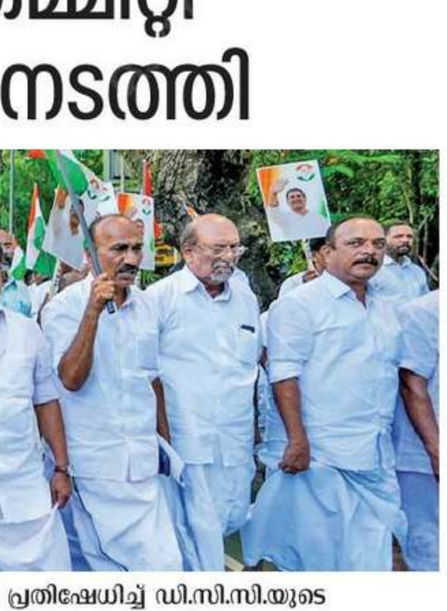
ഡി.വൈ.എഫ്.എ. പ്രതിഷേധപ്രകടനം നടത്തിയ പ്രതിഷേധപ്രകടനം

ഡി.വൈ.എഫ്.എ. പ്രതിഷേധപ്രകടനം നടത്തിയ പ്രതിഷേധപ്രകടനം. ഡി.വൈ.എഫ്.എ. പ്രതിഷേധപ്രകടനം നടത്തിയ പ്രതിഷേധപ്രകടനം.