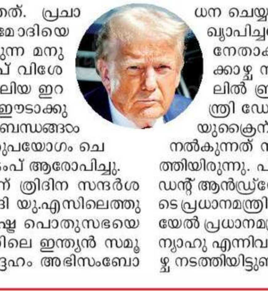
ട്രംപ് ഇന്ത്യയെ അഭയാനന്ദിയാക്കും

ഇന്ത്യ വ്യാപാരബന്ധം ദുരുപയോഗം ചെയ്യുന്നു എന്ന് വിമർശനം വാഷിങ്ടൺ. ട്രംപ് ഇന്ത്യയെ അഭയാനന്ദിയാക്കും. ഇന്ത്യയെ അഭയാനന്ദിയാക്കും. ഇന്ത്യയെ അഭയാനന്ദിയാക്കും. ഇന്ത്യയെ അഭയാനന്ദിയാക്കും.