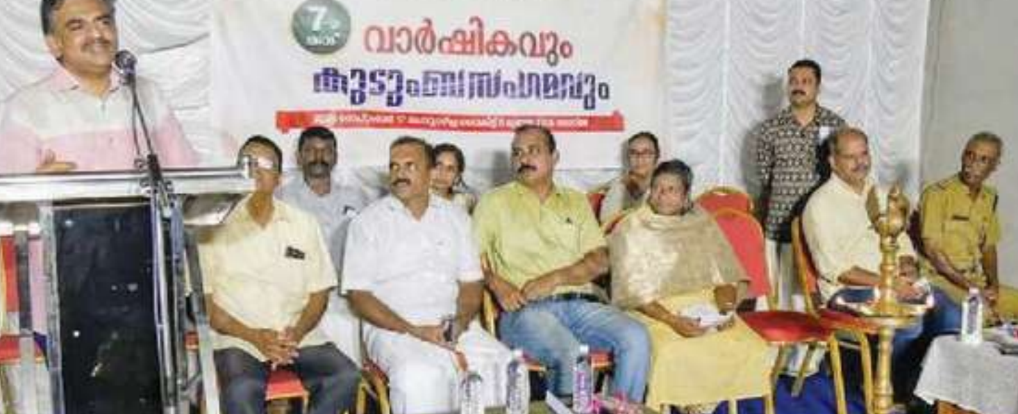
തൃപ്പൂണിത്തുറ അസോസിയേഷൻ വാർഷികം ഉദ്ഘാടനം ചെയ്യുന്നു

തൃപ്പൂണിത്തുറ അസോസിയേഷൻ വാർഷികം ഉദ്ഘാടനം ചെയ്യുന്നു. തൃപ്പൂണിത്തുറ അസോസിയേഷൻ വാർഷികം ഉദ്ഘാടനം ചെയ്യുന്നു.