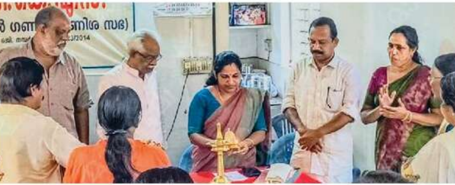
കെ.ജി.കെ.എസ്. തൃപ്പൂണിത്തുറ ശാഖ വാർഷികം ഉദ്ഘാടനം ചെയ്യുന്നു

കെ.ജി.കെ.എസ്. തൃപ്പൂണിത്തുറ ശാഖ വാർഷികം ഉദ്ഘാടനം ചെയ്യുന്നു. കെ.ജി.കെ.എസ്. തൃപ്പൂണിത്തുറ ശാഖ വാർഷികം ഉദ്ഘാടനം ചെയ്യുന്നു.