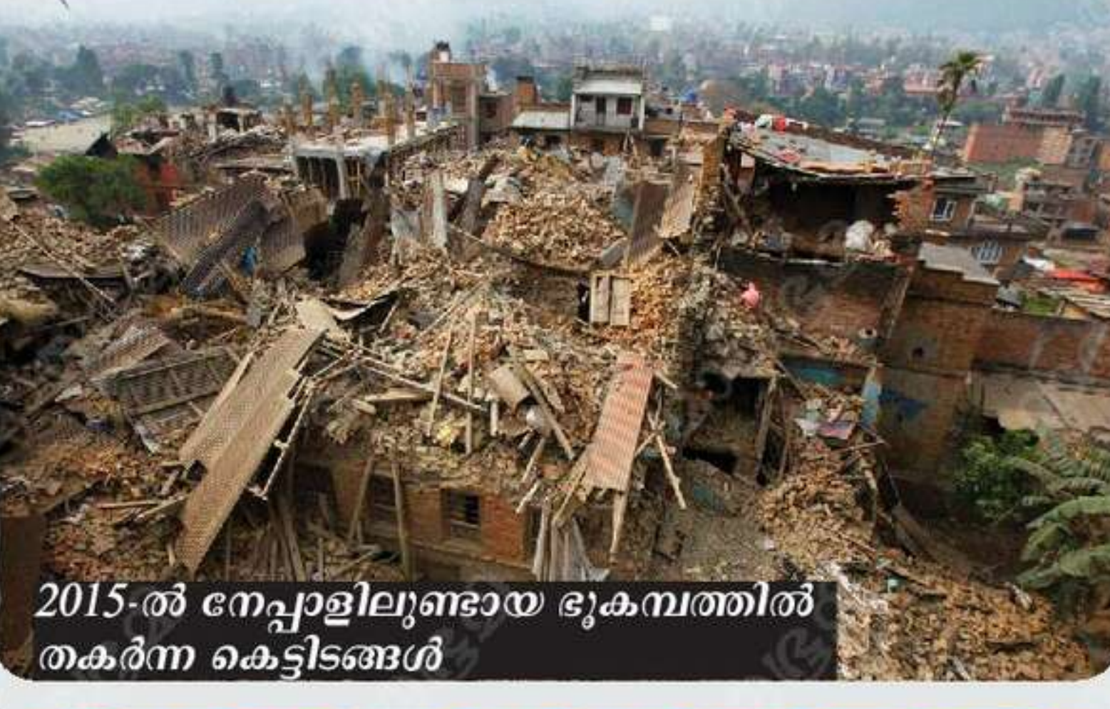
2015-ൽ നേപ്പാളിലുണ്ടായ ഭൂകമ്പത്തിൽ തകർന്ന കെട്ടിടങ്ങൾ

ഭ്രംശരേഖകൾ എന്ത്? കോടിക്കണക്കിന് വർഷങ്ങൾക്കുമുമ്പ് ഭൂമി കത്തിജ്വലിച്ചു കൊണ്ടിരുന്ന ഒരു ഗോളമായിരുന്നു. പിന്നീട് ഭൂവൽക്കം ആദ്യം തണുക്കുകയും ഉൾഭാഗങ്ങൾ പതുക്കെ തണുക്കാനാരംഭിക്കുകയും ചെയ്തു. ഇതിനാൽ ഭൂവൽക്കത്തിന്റെ പല ഭാഗങ്ങളിലും ആഴമേറിയ പൊട്ടലുകളുണ്ടായിട്ടുണ്ട്. ഇത്തരം പൊട്ടലുകളാണ് ഭ്രംശരേഖകൾ.