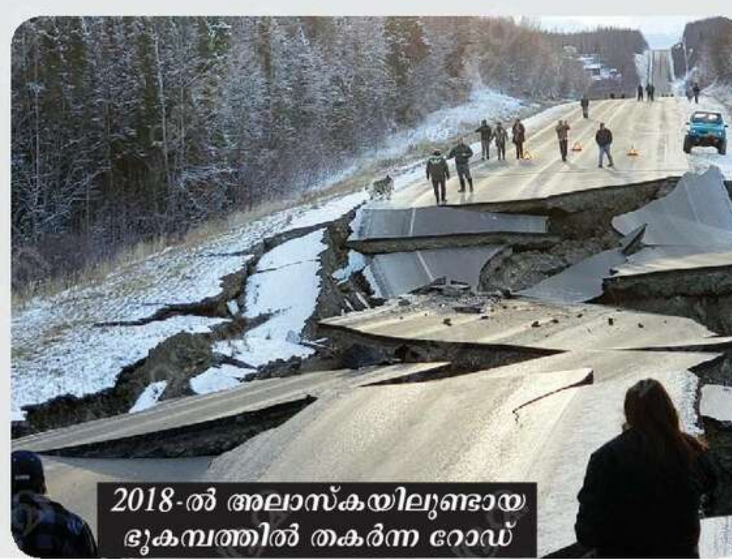
2018-ൽ അലാസ്കയിലുണ്ടായ ഭൂകമ്പത്തിൽ തകർന്ന റോഡ്