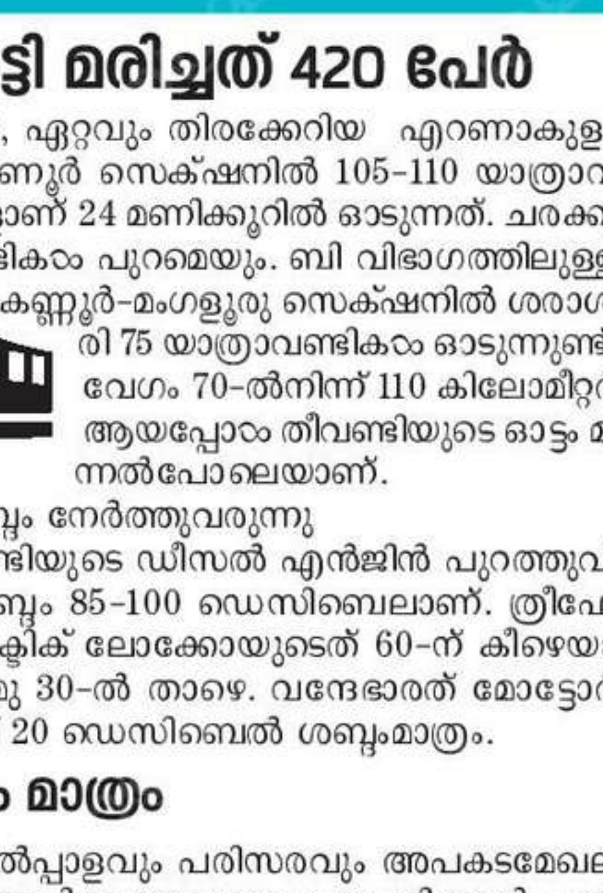
തിവണ്ടികളുടെ എണ്ണവും വേഗവും കൂടി, ശബ്ദം കുറഞ്ഞു

തിവണ്ടികളുടെ എണ്ണവും വേഗവും കൂടി, ശബ്ദം കുറഞ്ഞു. തിവണ്ടികളുടെ എണ്ണവും വേഗവും കൂടി, ശബ്ദം കുറഞ്ഞു.