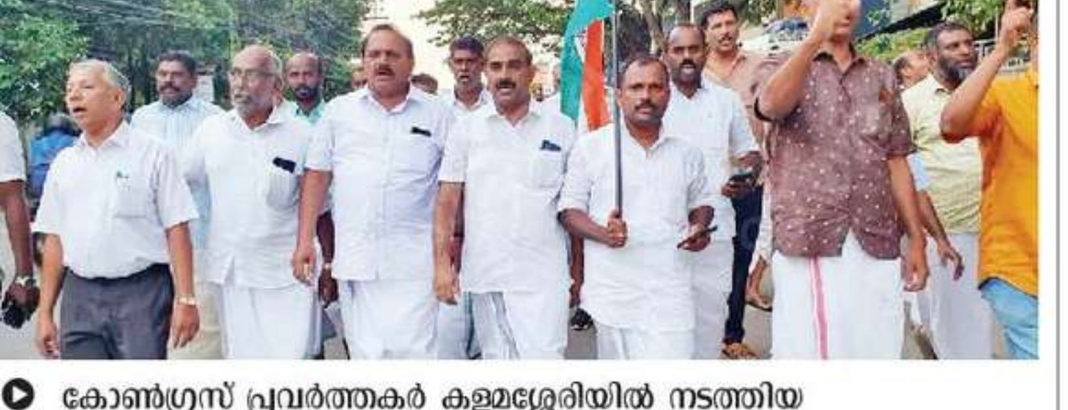
കോൺഗ്രസ് പ്രവർത്തകർ കളമശ്ശേരിയിൽ നടത്തിയ പ്രതിഷേധപ്രകടനം